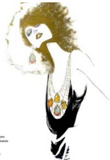
Goldoni Casa Le Bain de Femme 841x504 2012245e